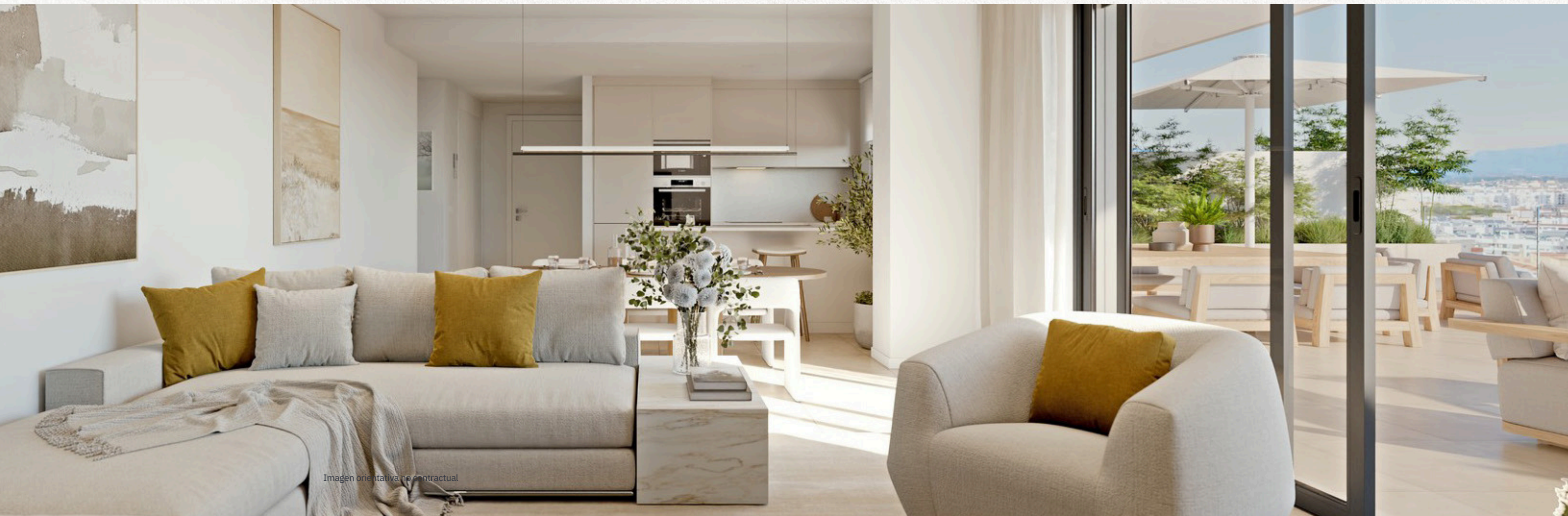
Imagen orientativa no contractual

Instalación eléctrica, conforme al Reglamento Electrotécnico de Baja Tensión y tomas de instalación de Telecomunicaciones conforme a la normativa vigente en salones, dormitorios y cocinas según normativa aplicable.