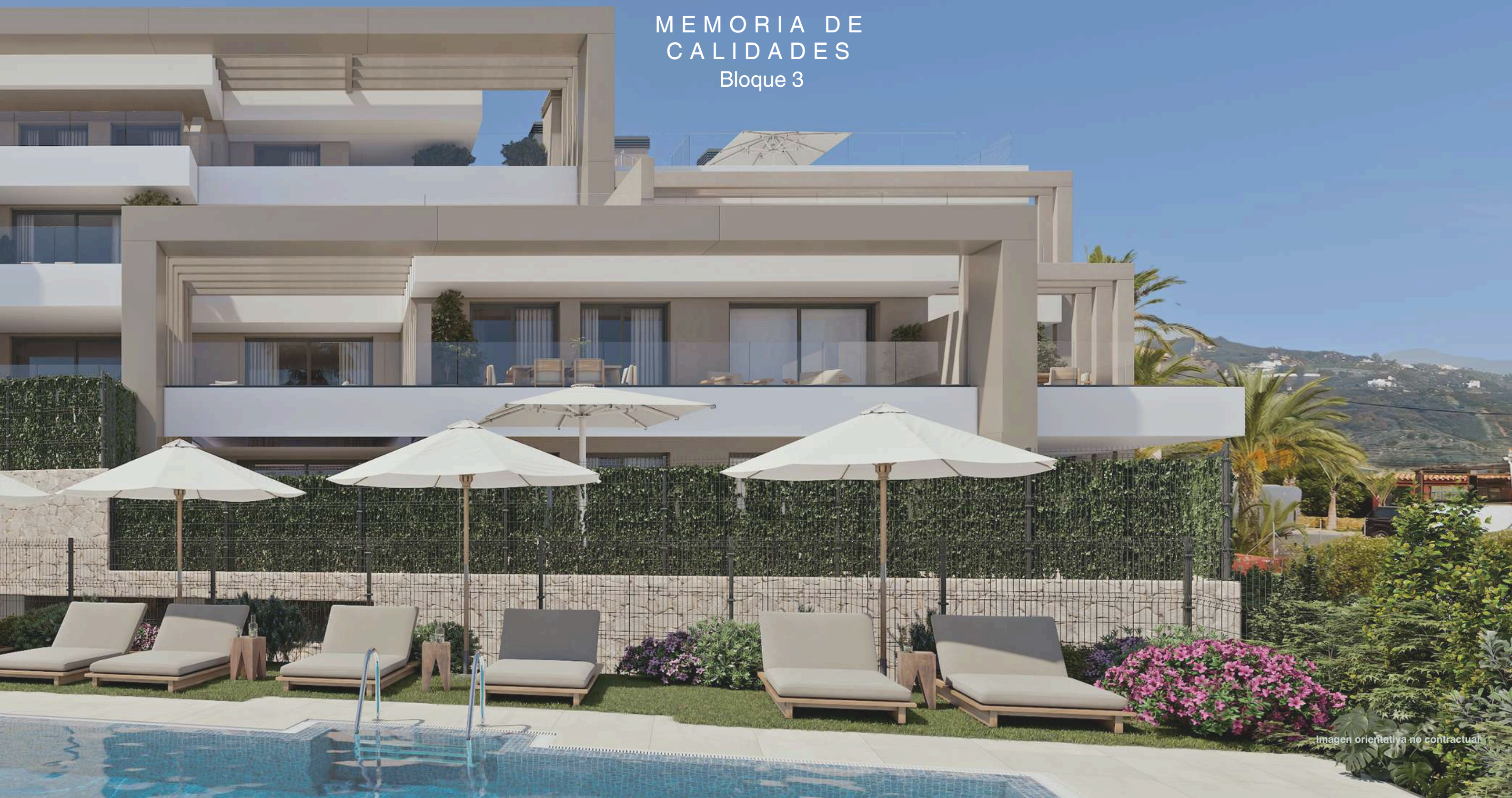
Imagen orientativa no contractual