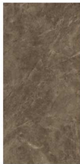
BAYONA P MOKA NATURAL BP2412L