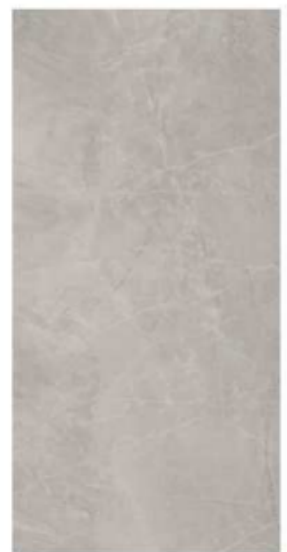
BAYONA SILVER NATURAL BP2412L