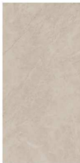
BAYONA IVORY NATURAL BP2412L