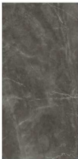
BAYONA P GREY NATURAL BP2412L

Los revestimientos de los baños serán aplacados de suelo a techo en una pieza de gran formato (240x120) de gres rectificado alta calidad de la serie BALDOCER, modelo BAYONA NATURAL